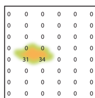
Matratze OHNE vorgeneigtem Fersenkeil.